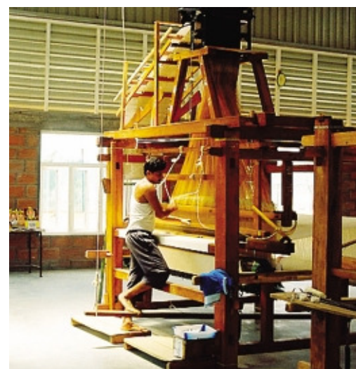
Un operaio al lavoro su uno dei telai