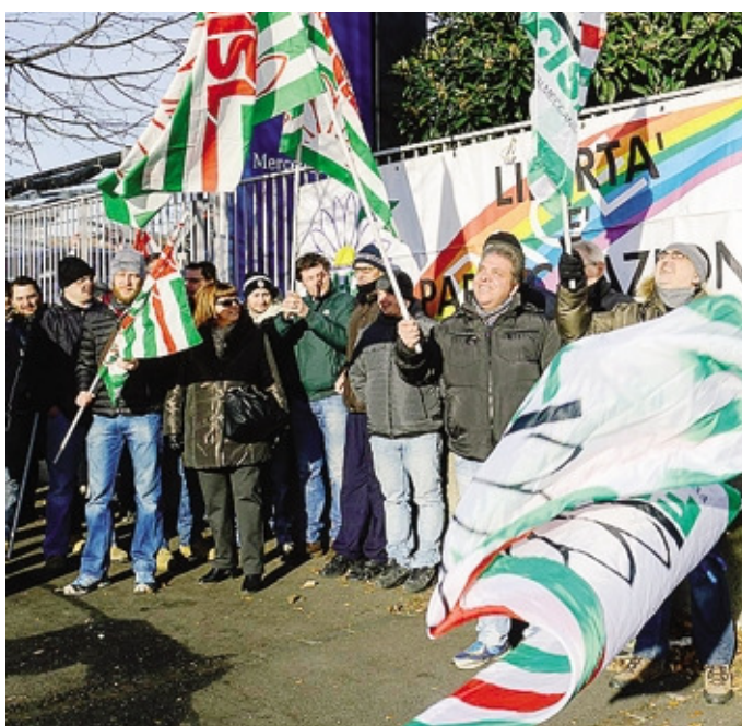
Un gruppo di dipendenti riuniti fuori dalla sede lo scorso gennaio

■ Si salva la sede di Busto Arsizio, ceduta come ramo d'azienda con i suoi dipendenti