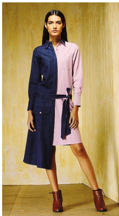
Uno degli abiti della collezione